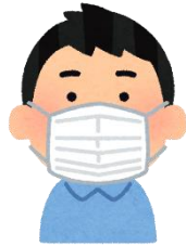
マスク ネックゲイター